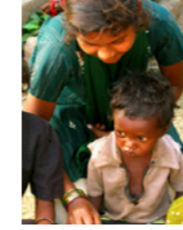
45. Jeune écolier d'un village tribal (Karnataka, Inde)