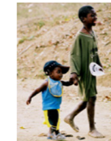
06. Enfants en chemin (Haïti)