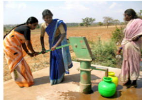
29. Femmes au puits dans un village tribal (Karnataka, Inde)