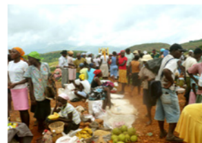
35. Jour de marché (Haïti)