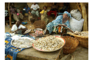
16. Marchande de poisson sur une rive du Niger (Ségou, Mali)