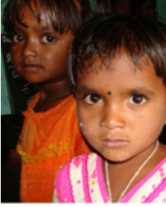
51. Ecolière d'une preprimary school dans un village tribal (Karnataka, Inde)