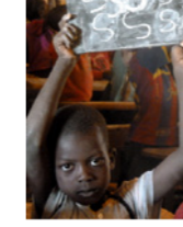
42. Ecolier (commune de Komki Ipala, Burkina Faso)