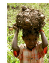
18. Enfant chargé de racines de yam dans une zone tribale (Karnataka, Inde)