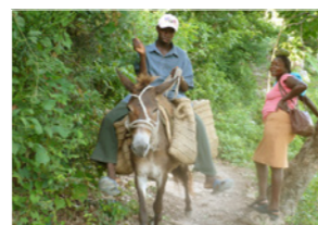
39. Homme en chemin vers son champ (Haïti)