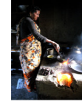
50. Préparation du repas dans une cuisine à l'équipement sommaire (Bangladesh)