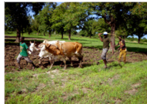
69. Agriculteur préparant son champ avant les semailles (commune de Daban, Mali)