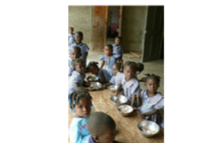
13. Enfant d'un centre de nutrition (Haïti)