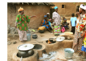
14. Préparation du repas sur foyers améliorés (Tagoni de Kassora, Mali)