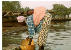
65. Nettoyage d'une calebasse dans le Niger (Ségou, Mali)