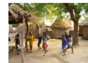
19. Enfants jouant au village (commune de Daban, Mali)