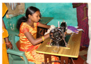
37. Jeune couturière dans un village tribal (Karnataka, Inde)