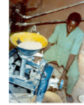
49. Meunier (commune de Dosso, Niger)