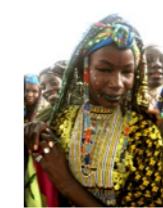
03. Jeune fille peule (commune de Farrey, Niger)