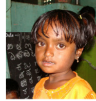
52. Ecolière d'une preprimary school dans un village tribal (Karnataka, Inde)