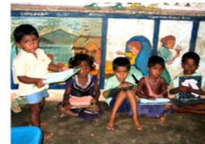
68. Ecoliers d'une preprimaryschool dans un village dalit (Tamil Nadu, Inde)