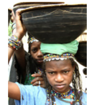
08. Jeune fille à la calebasse (Mali)