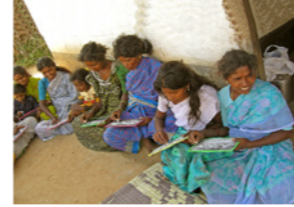
24. Séance d'alphabétisation dans un village tribal (Karnataka, Inde)