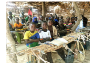
58. Classe sous paillette (commune de Farrey, Niger)