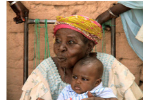
32. Grand-mère et son petit-fils (commune de Matameye, Niger)