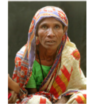
04. Portrait de femme (Bangladesh)