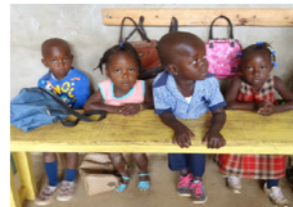
67. Enfants d'une école pré-élémentaire (Haïti)