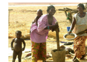
15. Pilage du mil au mortier (Mopti, Mali)