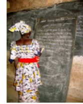
23. Séance d'alphabétisation en langue bambara (commune de Daban, Mali)