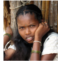
56. Jeune fille d'un village tribal (Karnataka, Inde)