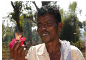
60. Homme à la fleur de flamboyant dans une zone tribale (Karnataka, Inde)