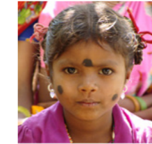
54. Enfant d'un village tribal (Karnataka, Inde)