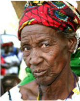
55. Portrait de femme (Commune de Daban, Mali)