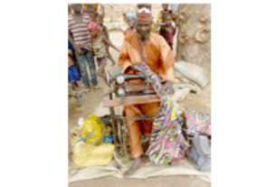
71. Couturier itinérant (commune de Dosso, Niger)