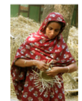
38. Femme pratiquant la vannerie (Bangladesh)