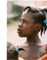
02. Portrait de jeune femme (Haïti)