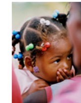
07. Portrait d'enfant (Haïti)