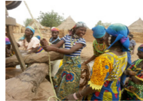
27. Jeunes femmes au puits (commune de Sembera, Niger)