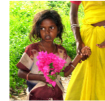
53. Enfant aux fleurs dans un village tribal (Tamil Nadu, Inde)