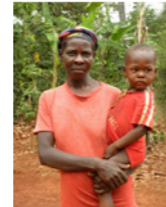
31. Portrait de femme (Haïti)