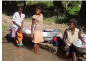
25. Lessive au ruisseau (Haïti)