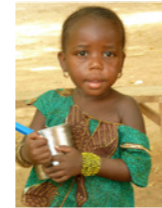
64. Petite fille de la région de Dosso (Niger)