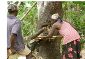
59. Extraction du jus de canne (Haïti)