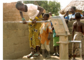
63. Corvée d'eau au forage (commune de Daban, Mali)