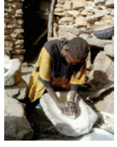
48. Broyage du mil au pays Dogon (Bandiagara, Mali)