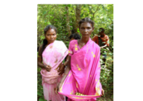
75. Cueillette de gooseberries dans la forêt du Rajiv Gandhi Park (Karnataka, Inde)