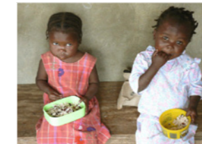
10. Petites filles d'un centre de nutrition (Haïti)