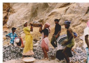
73. Transport de pierres dans une carrière (Tamil Nadu, Inde)