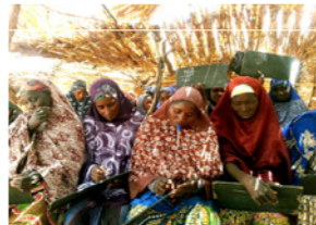
66. Séance d'alphabétisation (région de Kollo, Niger)