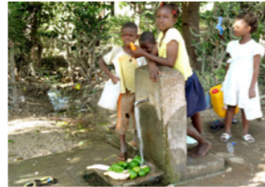
26. Nettoyage des légumes à la fontaine (Haïti)