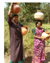
76. Femmes en route pour la corvée de l'eau dans une zone tribale (Karnataka, Inde)