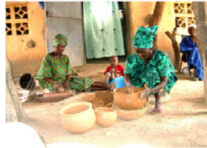
62. Potière de la caste des forgerons (commune de Daban, Mali)