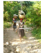
72. Femmes en route pour le marché (Haïti)