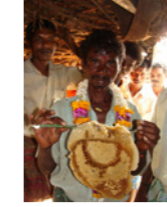
46. Homme au rayon de miel dans une zone tribale (Karnataka, Inde)