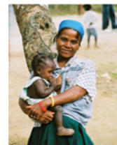
34. Femme et enfant au sein (Haïti)