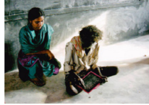
22. Séance d'alphabétisation dans un village tribal (Karnataka, Inde)