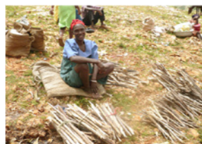
74. Femme au marché pour vendre ses fagots de bois (Haïti)