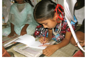
44. Ecolière dans un village (Bangladesh)