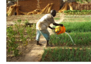
41. Arrosage du jardin potager (commune de Kankare, Burkina Faso)