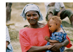
17. Portrait mère et enfant (Haïti)