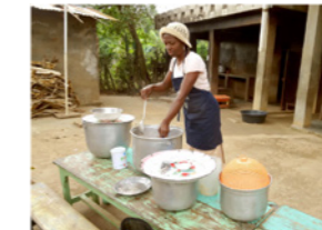
11. Préparation du repas dans l'arrière-cuisine d'une école (Haïti)