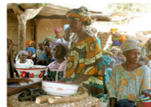
36. Remboursement des microcrédits (commune de Daban, Mali)