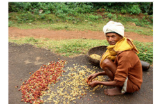
12. Décorticage de grains de café (Tamil Nadu, Inde)