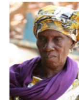
05. Portrait de femme (Mali)