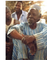
01. Chef de village (commune de Farrey, Niger)