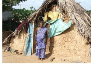
21. Hutte d'habitation dans un village tribal à la lisière de la forêt du Rajiv Gandhi Park (Karnataka, Inde)