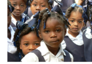
43. Ecolières en uniforme (Haïti)