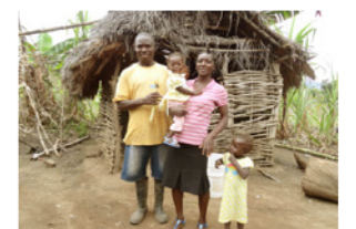
20. Famille devant sa maison (Haïti)