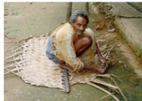
70. Tressage de feuilles de bambou pour réparer le toit dans un village tribal (Tamil Nadu, Inde)