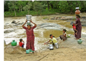
28. Corvée de l'eau à la rivière dans une zone tribale (Karnataka, Inde)