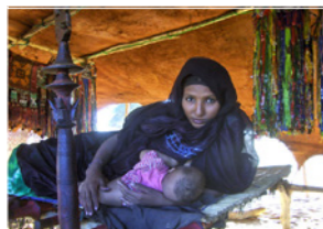
33. Jeune femme et son bébé sous la tente (région de Gao, Mali)