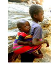
47. Enfants du pays Dogon (falaises de Bandiagara, Mali)