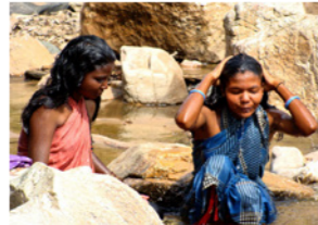
30. Toilette à la rivière dans une zone tribale (Karnataka, Inde)