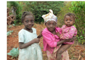
09. Fillettes au champ (Haïti)