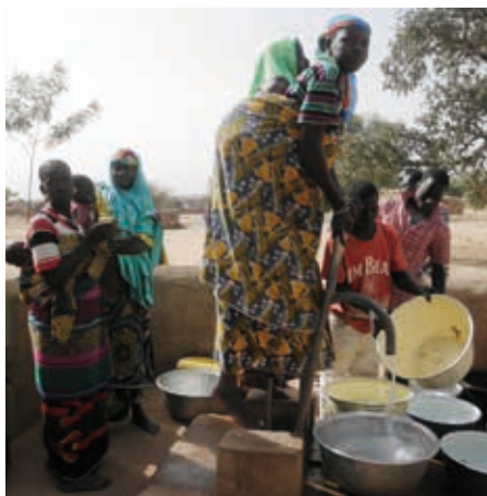
Les femmes au point d'eau à Semari

Lors de nos passages au village, pendant les missions, il était très dur de rencontrer la population. Nos discours ne semblaient pas retenir l'attention du jeune chef de village, ce qui nous désolait. Lors de la mission de novembre 2012, je n'avais rencontré que le directeur de l'école et 4 femmes. Dans de tels cas, on a envie de tout arrêter! Je me souviens encore de ces 4 femmes qui avaient bien compris que leur jumelage avec Péluussin était une grande chance non seulement pour elles, mais aussi pour leur famille et tout le village. Elles nous remercièrent pour ce qu'elles avaient déjà appris aux cours et elles nous demandèrent de ne pas les abandonner. Nous avons fait