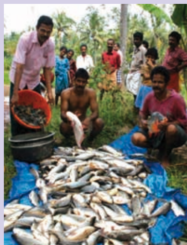
Produit de la pêche de Mr J