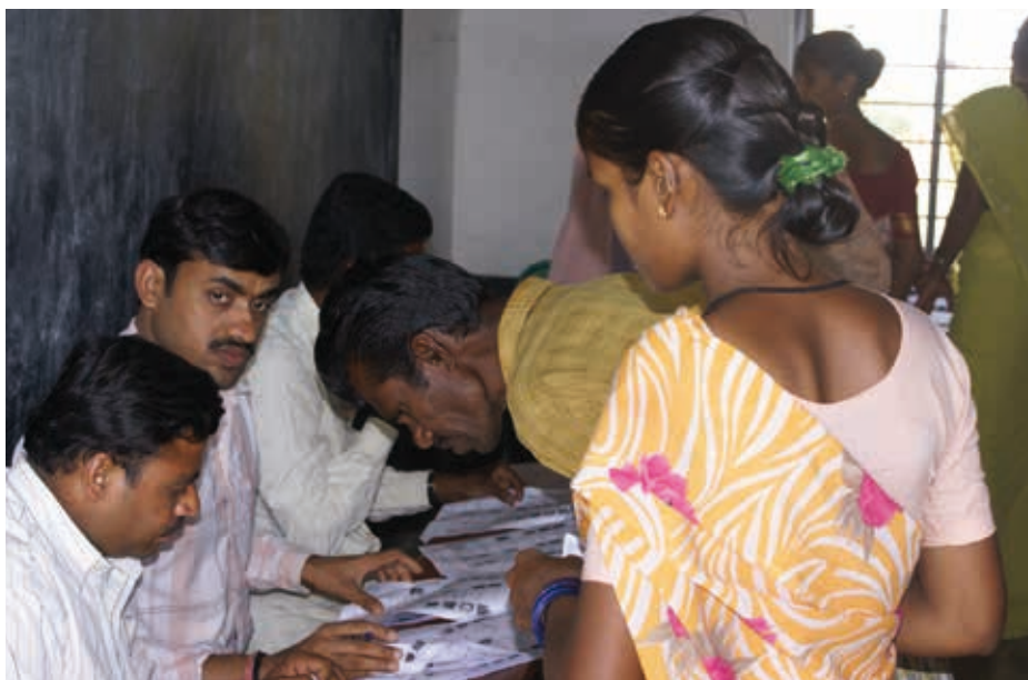
Bureau de vote à Bangalore

Mr Modi inquiète les partisans d'une Inde laïque et tolérante mais satisfait les milieux industriels et beaucoup d'Indiens qui voient en lui « l'homme du développement ».