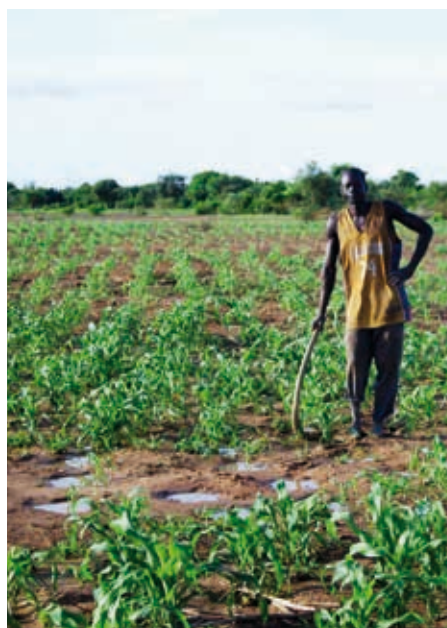
Champ cultivé avec la technique du zai au Burkina Faso

Il faut protéger l'agriculture familiale moderne, diamétralement opposée à une