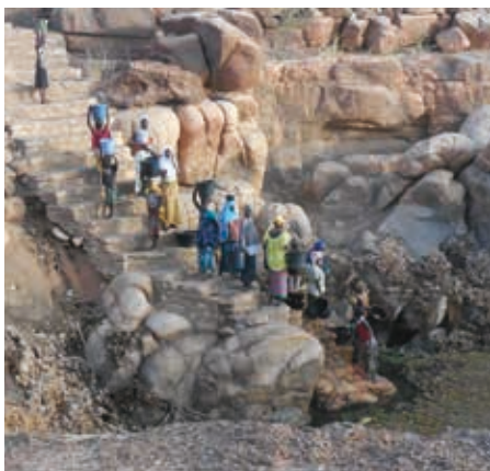
Les femmes au point d'eau à Semari

années, se retrouve confronté à trop de difficultés successives. La vie dans les villages de la rive gauche du Niger est particulièrement délicate et on se demande parfois comment leurs habitants peuvent résister, à la limite de la survie.