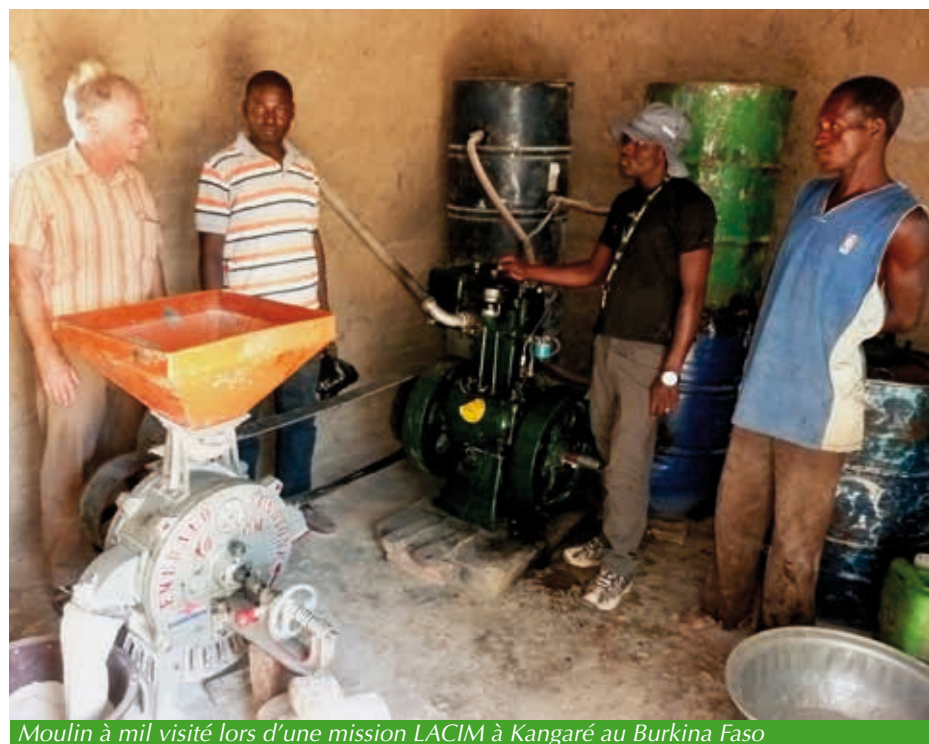
Moulin à mil visité lors d'une mission LACIM à Kangaré au Burkina Faso