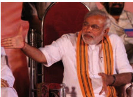
Narendra Modi

Le PJB dont est issu Mr Modi s'est développé en s'appuyant sur des organisations fondamentalistes hindouistes. L'élection de