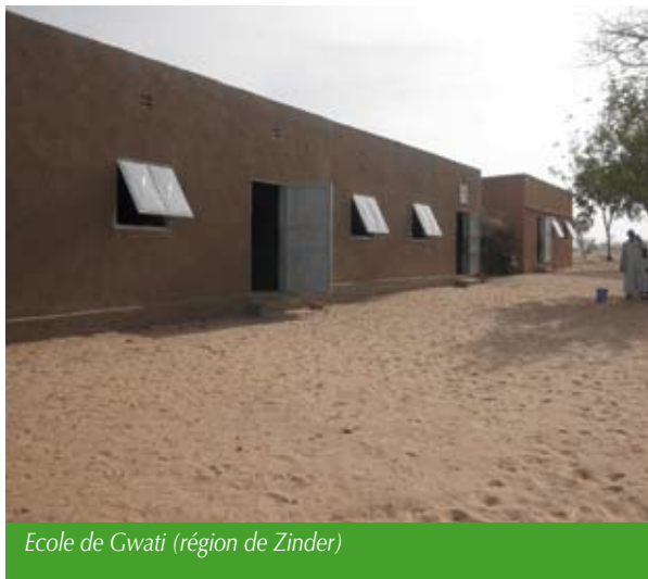
Ecole de Gwati (région de Zinder)

Nous proposons donc aux comités de nouveaux jumelages essentiellement sur la région de Dosso où nous concentrons nos actions dans les départements de Douchi et de Dosso. Les projets que nous développons actuellement sur cette région concernent l'alphabétisation, l'agriculture durable et la réhabilitation de forage . Nous essayons aussi de mettre en place des projets plus en concertation avec les Maires des communes. Notre souhait serait de monter un projet important concernant l'ensemble des jumelages d'un département ou même de la région.