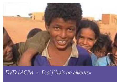
DVD LACIM « Et si j'étais né ailleurs »

peu abondantes, pour ensemercer leurs champs en mai ou en juin. Après deux sarclages espacés d'un mois, vient le temps de la récolte en septembre. Dès lors s'ajoute le temps du séchage des grains et du vannage par les femmes et les jeunes filles. Celles-ci s'emploient à l'aide d'une calebasse remplie de grains, bras levés, à les faire tomber dans une autre calebasse et à contrevent de manière à éliminer tous les déchets de paille et autres. Puis les femmes et les filles s'activent à réduire en farine les grains à l'aide d'un pilon. Travail pénible et qui demande beaucoup d'énergie. Cette farine sera employée dans la préparation de la bouillie, base de tous les repas. La viande ou le poisson, quand il y en a, est réservé aux hommes. Les paysans apprennent également à amender la terre en faisant du compost avec les tiges des plants de mil ou autres végétaux. Pour éviter l'érosion, ils