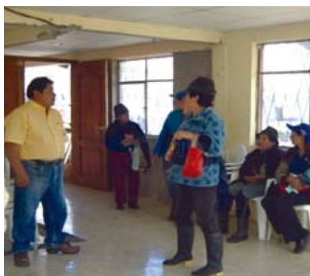
Les cours sur les procédés de la culture du maïs ont été suivis avec assiduité

D ifférents travaux ont été réalisés entre janvier 2011 et mars 2012. Tout d'abord, l'administration de médicaments aux bovins afin d'éliminer les parasites gastro-intestinaux et pulmonaires et l'administration d'autres produits pour les aider à éliminer les toxines lors de l'ingestion de cendres. Il leur a aussi été donné des vitamines AD3E pour compenser les insuffisances des pâturages.