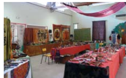
Chaque expo-vente nécessite 40 tables d'exposition pour présenter les milliers d'objets