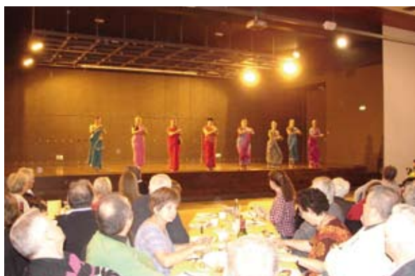
Lors de la soirée indienne, les danseuses assuraient le spectacle

Chaque année, nous avons à cœur de participer à l'opération mimosa et nous ne commandons que le nombre de bouquets vendus à l'avance pour ne pas avoir de pertes. Aussi, une année sur deux, nous organisons une brocante sur les boulevards montbrisonnais et une exposition-vente dans les locaux que la mairie met à notre disposition gratuitement.