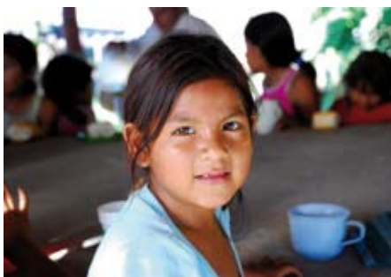
Aide alimentaire à Villa Guillerma, village de la Province de Santa Fé