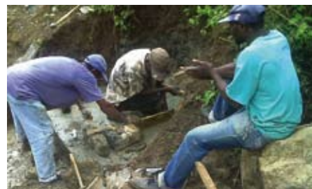
Nettoyage d'une source et confection d'un bassin

Au nom de toute la population bénéficiaire et surtout des membres de l'organisation des Femmes Vaillantes de Beauséjour, nous ne trouvons pas les mots pour vous exprimer notre gratitude pour ce noble projet que LACIM nous permet de réaliser pour le bien des familles paysannes de