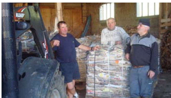
Les bénévoles collectent les journaux en vue de les recycler

Chaque année, à la mi-novembre, nous organisons un repas qui nous permet de récolter des fonds pour poursuivre avec efficacité l'aide apportée à nos 3 jumelages. Ce repas constitué d'une choucroute est une véritable tradition au Comité de Montbenoit puisqu'il existe depuis la création du comité. Cette année, 500 repas ont été préparés, emportés ou servis dans la salle polyvalente par une douzaine de bénévoles. Une tombola organisée au cours de la soirée assure l'animation et permet de contribuer aux frais de fonctionnement du Centre de Carice. Outre son côté convivial, cette manifestation fait quelques heureux dans la salle avec des lots multiples et variés. Merci à toutes