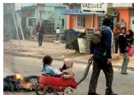
Quotidien des habitants de Derqui, situé à 30 kms de Buenos Aires

Cette réunion a permis aux adhérents de voir l'utilisation qui est faite de leurs dons et nous a confortés dans l'idée qu'il est important de continuer notre aide à ces « coins » d'Argentine touchés par la pauvreté.