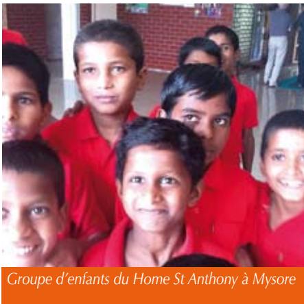
Groupe d'enfants du Home St Anthony à Mysore

A u Karnataka, le dénuement persiste dans les zones tribales des Adivasi vivant dans la forêt (avec un probable déplacement à court terme) ou aux confins de celle-ci. Nos actions articulées avec Pragathi ont du mal à se mettre en place : les programmes de développement ne se pérennisent pas et relèvent trop souvent de l'assistanat, ce qui n'est pas la vision de LACIM d'un partenariat efficace. Mais il serait dommage d'abandonner ces villages car, de tous ceux que nous avons visités, ce sont les plus nécessiteux. On peut quand même s'enorgueillir de la belle réalisation du Home St. Anthony, lieu d'accueil et de scolarisation pour les orphelins adivasi de cette région du Karnataka.