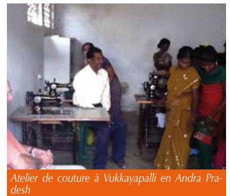
Atelier de couture à Vukkayapalli en Andhra Pradesh