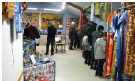
Beaucoup de visiteurs ont l'habitude de se rendre d'année en année aux expositions-ventes

C'est également un temps privilégié pour passer des films, afficher des panneaux expliquant le but de LACIM et les projets en cours du comité avec